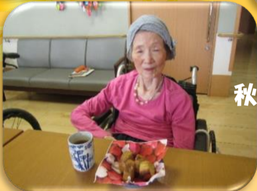
秋の足音が聞こえる